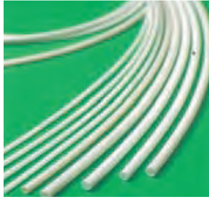
▲クロスチューブへの応用