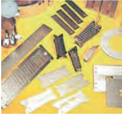
▲電熱用集成マイカ板への応用