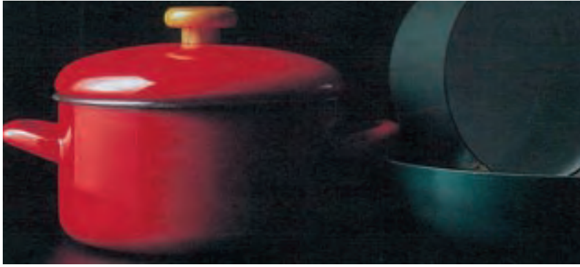
▲なべ、フライパンなどの調理器具への応用