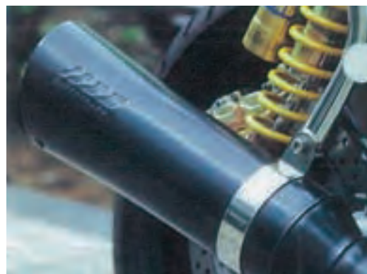
▲オートバイマフラーへの応用

変性シリコーンレジンには、アルキッド樹脂、ポリエステル、エポキシ樹脂等で変性しており、有機樹脂の特性を生かした塗料が得られます。