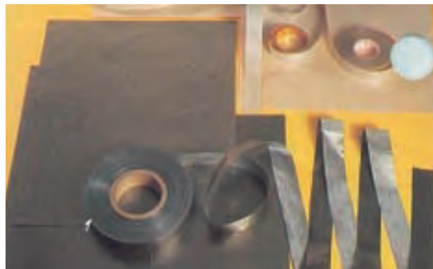
▲集成マイカシート・テープへの応用

硬化後の塗膜特性が、柔軟性を有するものから、含浸を目的とした低粘度タイプのシリコーンレジン、耐熱性や難燃性を必要とする用途に適した各種シリコーンレジンがあります。