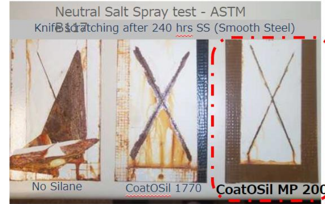
著しく不良 不良 良好